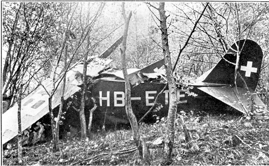
Flugzeugabsturz im Tessin.

Am Samstag vormittag stürzte in Certara im Val Colla ein schweizerisches Privatflugzeug aus Zürich ab. Die drei Insassen fanden den Tod.