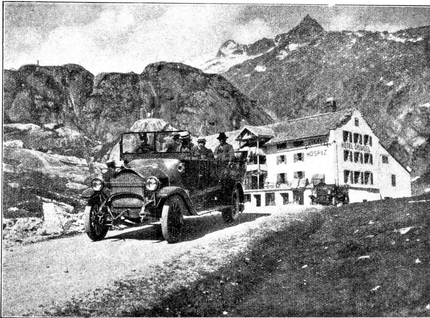
Das alte Grimsel-Hospiz.

weder Ihre Verhältnisse noch ihre Verwandtschaft, und was man so hört, klingt nicht gerade vertrauensvoll.“