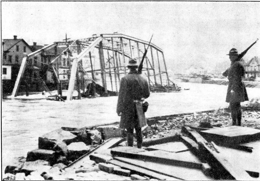
Eine Brücke von der Flut weggeschwemmt.

Unser Bild zeigt: eine Brücke, die von den Fluten von ihrem Fundament gerissen und vom Fluß Creek fortgeschwemmt wurde. Die Brücke befindet sich jetzt in der Stadt Johnstown im Staate Pennsylvania.