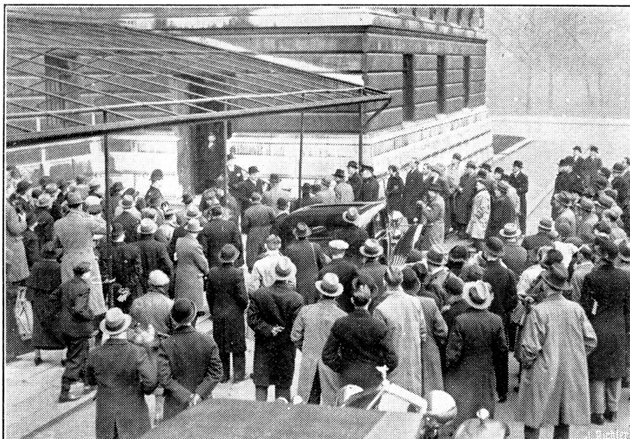
Locarno-Mächte tagen in London. Menschenmenge vor dem Foreign Office.

Eine Ansicht der Menschenmenge vor dem Foreign Office in London während der Lunchzeit; Der italienische Botschafter und Delegierte bei der Konferenz, Grandi, verlässt eben das Gebäude und wird von den Presse-photographen „gestellt“.