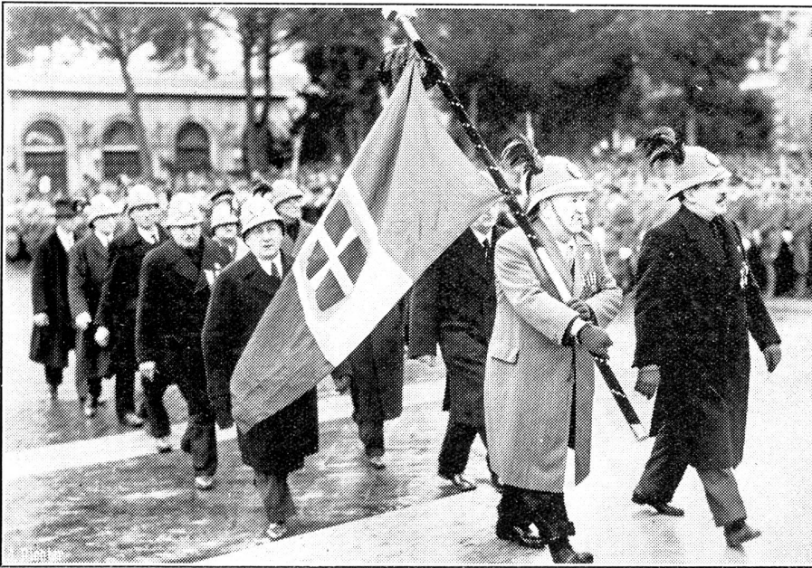
Der 40. Jahrestag der Schlacht bei Adua.

In Rom, auf dem Altar des Vaterlandes, wurde bei diesem Anlasse eine feierliche Messe gehalten. Unser Bild zeigt Ueberlebende aus der Schlacht bei Adua im Jahre 1896, die der Messe beiwohnten.