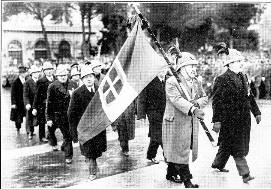
Der 40. Jahrestag der Schlacht bei Adua.

In Rom, auf dem Altar des Vaterlandes, wurde bei diesem Anlasse eine feierliche Messe gehalten. Unser Bild zeigt Ueberlebende aus der Schlacht bei Adua im Jahre 1896, die der Messe beiwohnten.