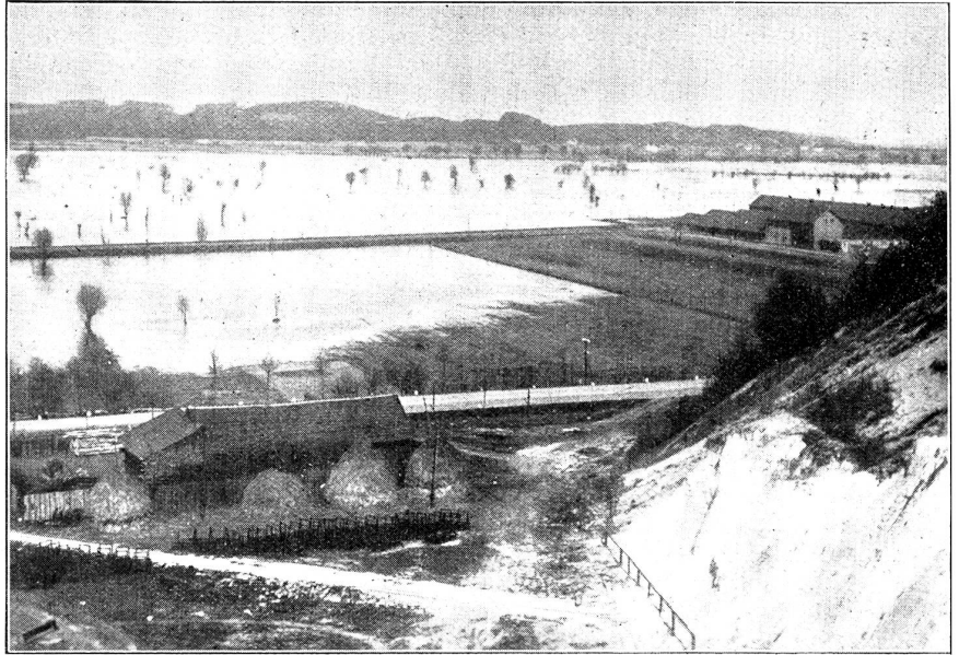
Ueberschwemmung der Oder.

Dann kam das Eis von den Alpen herab und hinterließ als Andenken nördlich des Bodensees Schuttwälle. Riesige