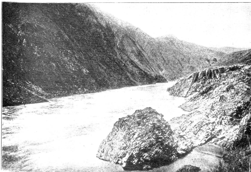
Der „Gelbe Fluß“.

Man sollte nun annehmen, solche Flußverlegungen und Aenderungen innerhalb der Flußsysteme geschähen ganz allmählich im Laufe von Jahrtausenden oder Jahrhunderten, und unser Menschenleben sei viel zu kurz dazu, als daß wir von Ereignissen solcher Art etwas bemerken würden. Diese Annahme ist aber — leider! — ein Irrtum. Wenn größere Flüsse ihre Richtung ändern, so geschieht dies nämlich heute wie in vorsintflutlicher Zeit meist in Form von Katastrophen. Ueberschwemmungen großen Ausmaßes waren bis weit in die Neuzeit hinein, bis zur Regulierung der deutschen Flüsse, vor allem zur Frühjahrszeit, in unserer Vaterlande an der Tagesordnung. Besonders gefährlich waren solche Ueberschwemmungen bei Flüssen, die im wesentlichen in Südrichtung fließen, weil die Schneeschmelze im Süden zeitiger einzusetzen pflegt und die dadurch angeschwollenen Wassermassen des Stromes sich vor dem noch vereisten Unterlaufe des Stromes stauen. Die Anzahl von Altwässern, welche man heute noch längs des Laufs der meisten deutschen Flüsse, oft