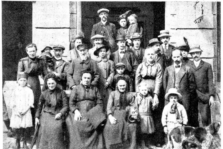
Herberge zur Heimat, Bern. Eine Gruppe belgischer Flüchtlinge.

Wir entnehmen all diese Ausführungen einer sehr hübsch ausgestatteten Broschüre, die der Herbergsvater anlässlich des 25jährigen Jubiläums herausgegeben hat und in der er lebhaft Schilderungen über das Leben und Treiben in diesem eigenartigen Gasthaus entwirft. Immer mehr wird es von Privaten besucht, sei es von Kongreßteilnehmern, Reisegesellschaften, Schulen, Instituten aus aller Herren Länder. Auch Geschäftsreisende besuchen vielfach die Herberge zur Heimat. Darüber werden aber die eigentlichen Gäste, die heimatlosen und wandernden Burichen, nicht vergessen. Durch Zumietsen von Wohnungen in der Nachbarschaft wurde der Betrieb bedeutend erweitert, und so ist denn die Herberge zur Heimat zu einem Volkshotel geworden. Von jeher vermochte er sich selber ohne Subventionen zu erhalten. H.C.