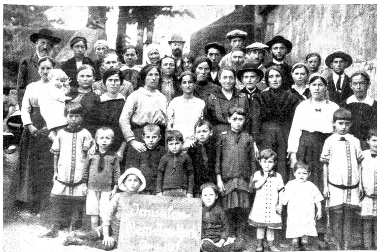
Jüdische Emigranten auf der Reise von Jerusalem nach Amerika.