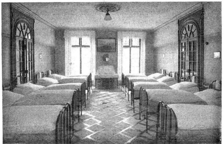
Herberge zur Heimat, Bern. Ein Schlafsaal.