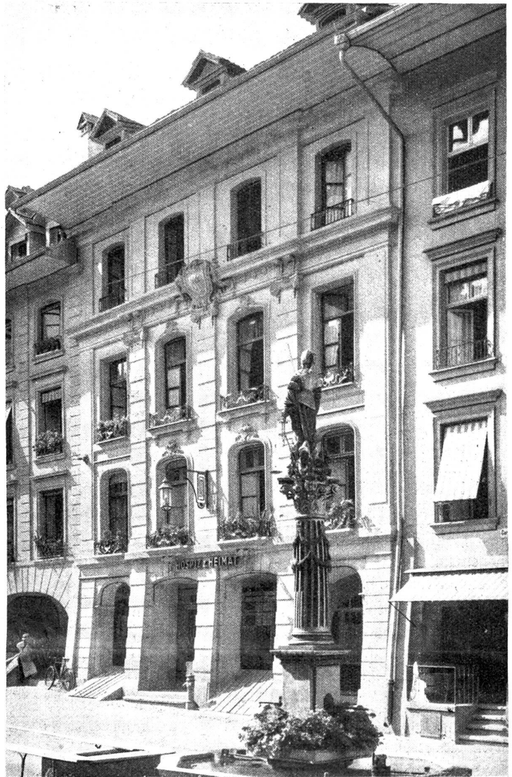
Die Herberge zur Heimat an der Gerechtigkeitsgasse, Bern. Zum Aufsatz S. 144.