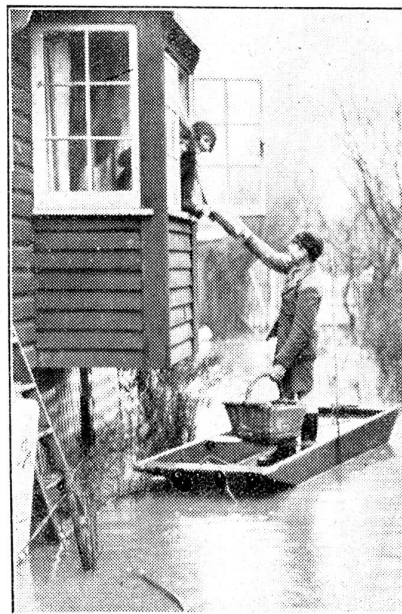
Erneute Ueberschwemmungen in England. Bäckerjunge im Kahn.

verhandelt wurde? Das Ausschalten Italiens durch den Krieg, sein abnehmender Einfluß an der Donau, seine militärische Bedeutungslosigkeit für den Fall einer Verwicklung seien, so heißt es, die Gesprächsthemen gewesen. Auf gut