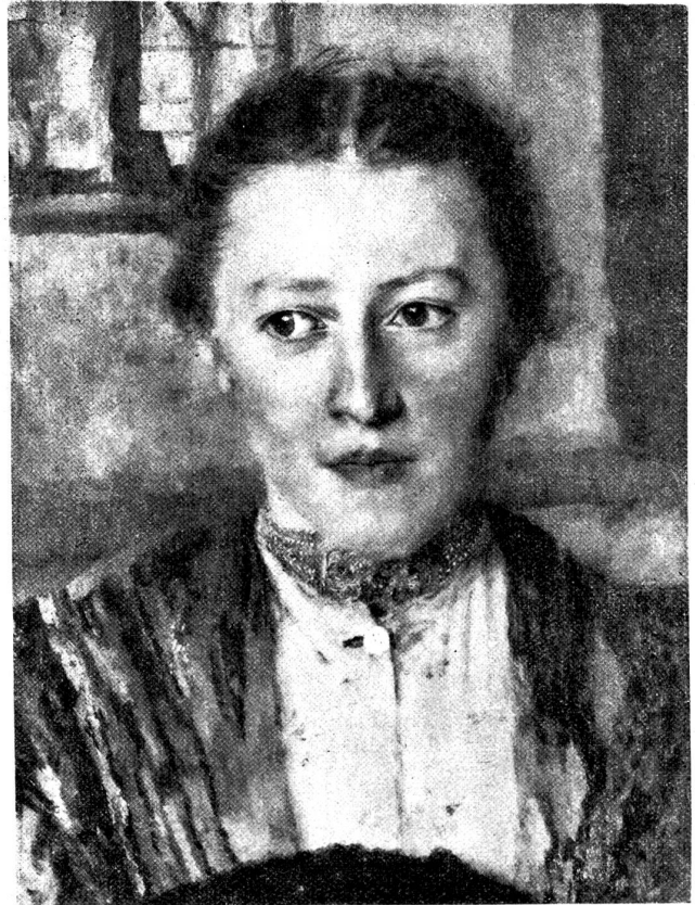
Wilhelm Leibl: Bauernmädchen mit Halskette. (Ausstellungskatalog.)

„Dieser Schlendrian in der Schule“, fuhr der Direktor lebhaft fort, „hat lange genug gedauert. Dieser filzige Schultubenfram hat sich den Leuten des Dorfes und der Gemeinde mitgeteilt. Ob hablich oder arm, ob Bauer oder Knecht, ob Arbeiter oder Gewerbler, ob Dorfagnat oder williges Stimmfutter, alles gondelt in plump überlieferten