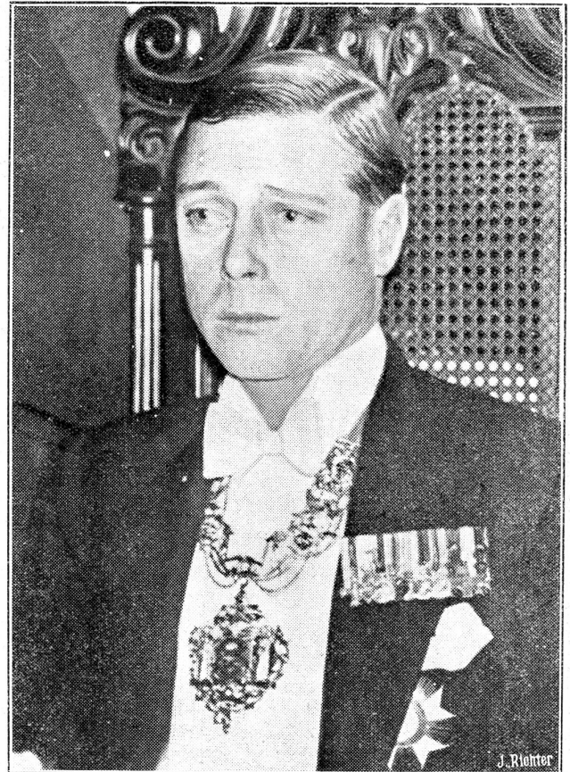
Eduard VIII., der neue König von England.

dikalen Minister, mit Herriot sieben Mann, sind bereit, ihm zu folgen. Die radikalen Parteiinstanzen haben in einer Vollversammlung diesen gemeinsamen Rücktritt gutgeheißen und der Kammerfraktion die konsequente Durchführung der von der Partei gewünschten Politik im Parlament nahegelegt. Das heißt, daß die Partei ein Aufhören des bisherigen Schwankens wünscht. In ihrer Tagesordnung wird außen- und innenpolitisch mit dem Lavalkurs abgerechnet. Kampf gegen die Liguen! Kampf gegen die Wirtschaftspolitik, welche die Privilegien des Geldes statt die Interessen der Arbeit in den Vordergrund stellt. Kampf gegen eine Außenpolitik, welche nicht strikte die Linien des Völkerbundes befolgt.