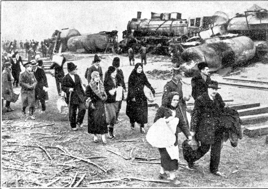
Ein schwerer Betriebsunfall ereignete sich in Rumänien durch den Zusammenstoß von zwei Petroleum-Zügen, die dadurch in Brand gerieten.

iniens höflich-höhnisches „Undenkbar“ den Rat der Aufgabe einer Abstimmung enthebt, so wird das Nein des Rates aus einer Protestwelle der übrigen Welt von selbst fließen.