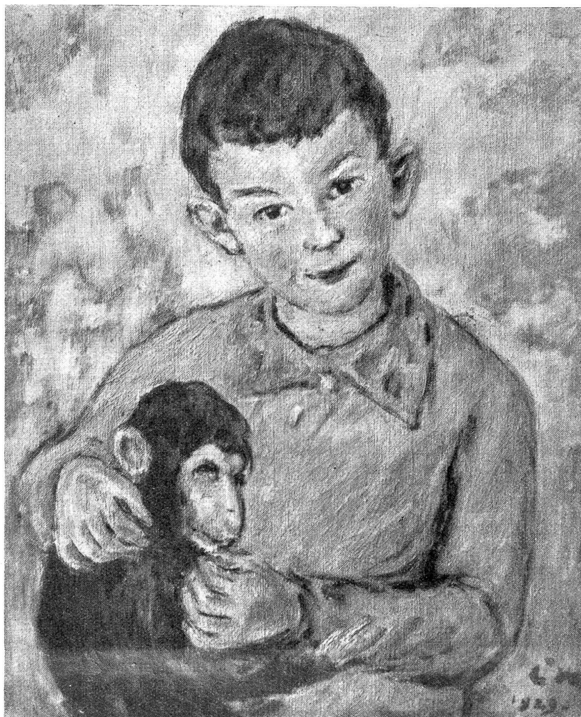
Louis de Meuron, Marin: Denys. Aus „O mein Heimatland 1936. Verlag Dr. Gustav Grunau, Bern.

Das Schiff hatte sich unterdessen mit festtäglichen gebleibtem Volke gefüllt. Die Orgel begann zu jubeln, Geigen verhauchten sehnsüchtig, der junge Priester im golddurchwirkten Ornat, die Leviten und Chordienner, seine geistlichen Verwandten, die Braut und Meinrad, sein großer Gönner, hielten Einzug in die Kirche, königliche Ehren wur-