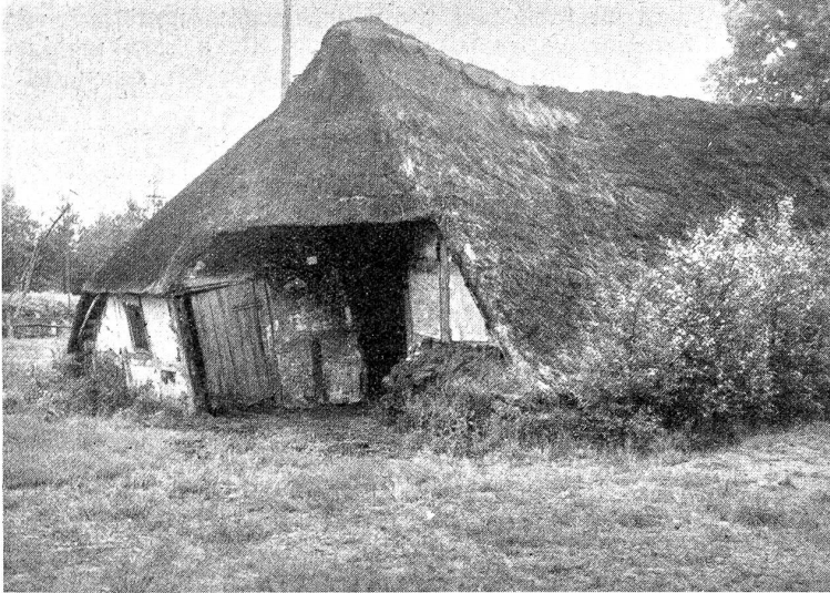
Moorkate im Teufelsmoor bei Worpswede.

1901 trat er von seinen Geschäften zurück, verkaufte seine sämtlichen Gründungen dem berühmten und vielleicht auch berühmtesten Morgan. Bis zu seinem Tode bemühte sich Andrew Carnegie nun mit der Verteilung seines Reichtums. Für seine ehemaligen Arbeiter stiftete er 4 Millionen, eine weitere Million — immer Golddollars — für die Gründung von Arbeiterbibliotheken und Lesesälen. Den New Yorker Volksbibliotheken schenkte er 5\frac{1}{4} Millionen, gründete am 28. Januar 1902 das Carnegie-Institut in Washington mit zunächst 10 Millionen, die er später auf 25 erhöhte. Dieses Institut sollte in großzügiger Organisation der wissenschaftlichen Forschung dienen, der Entdeckung, der praktischen Verwertung aller Kenntnisse für den Fortschritt der Menschheit, der Förderung von Kunst und Literatur. Endlich stiftete er den sogenannten Heldenfonds zur Belohnung von Helden, die Menschenleben gerettet haben, zur Unterstützung von Familien, deren Väter oder Söhne bei der Lebensrettung verunglückten. Im Laufe der Zeit wurde dieser Fonds auch England, Frankreich, Deutschland, Italien, Belgien, Holland, Norwegen, Schweden, der Schweiz und Dänemark dienstbar gemacht: „Die Helden der barbarischen Vergangenheit verwundeten oder töteten ihre Mitmenschen; die Helden unseres zivilisierten Zeitalters setzen es sich zum Ziel, ihren Brüdern zu dienen und sie zu retten. Das ist der Unterschied zwischen physischem und moralischem Mut, zwischen Barbarei und Kultur“.