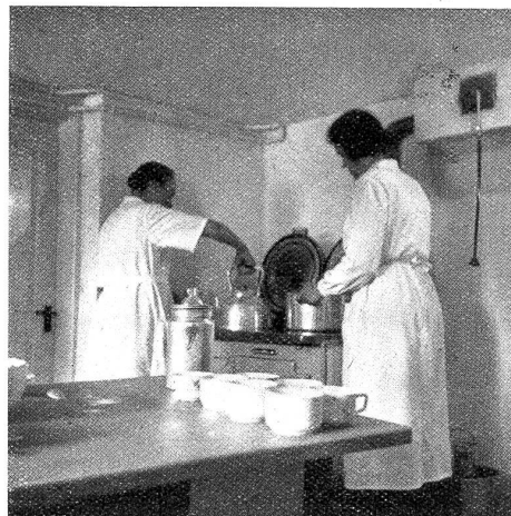
Heim für Straftlassene in Waldkirch. Küche.

richtung dieses behaglichen Heims, das 25 Männern Unterkunft zu bieten vermag, ist den Straftlassenen eine schwere Sorge vom Herzen genommen. Sie wissen nun, wo ihnen