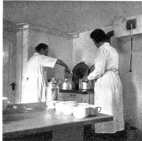
Heim für Strafentlassene in Waldkirch. Küche.

richtung dieses behaglichen Heims, das 25 Männern Unterkunft zu bieten vermag, ist den Strafentlassenen eine schwere Sorge vom Herzen genommen. Sie wissen nun, wo ihnen