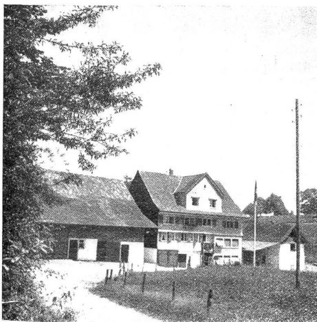
Heim für Strafentlassene in Waldkirch. Hauptgebäude.

Das Heim ist mit allen neuzeitlichen Einrichtungen, wie Zentralheizung, Warmwasserversorgung, sowie einer Pump- und Druckanlage für die Wasserversorgung ausgestattet. Im