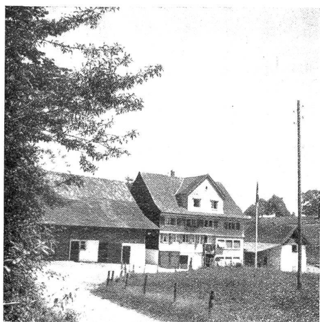
Heim für Straftlassene in Waldkirch. Hauptgebäude.

Das Heim ist mit allen neuzeitlichen Einrichtungen, wie Zentralheizung, Warmwasserversorgung, sowie einer Pump- und Druckanlage für die Wasserversorgung ausgestattet. Im