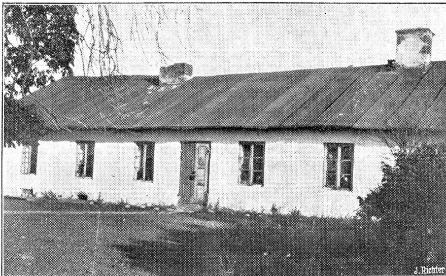
Das Geburtshaus Chopins in Zelazowa Wola, das als Chopin-Museum umgewandelt der Öffentlichkeit zugänglich gemacht werden soll.

Außer dieser Propagandarede, die vor allem Italien hören sollte, hat die Regierung in Rom auch andere Worte hören lassen. Ihr Sprecher England gegenüber ist wie immer Laval. Das Prestige verbietet, direkt vor den Gegner zu treten. Und Laval versucht auch gleich, für seinen Freund einen enormen Vorteil herauszuwirtschaften: Einstellung der sowieso auf 15. November verfallenden