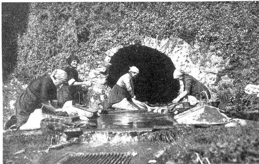
Tessiner Frauen waschen an der warmen Quelle in Ascona.