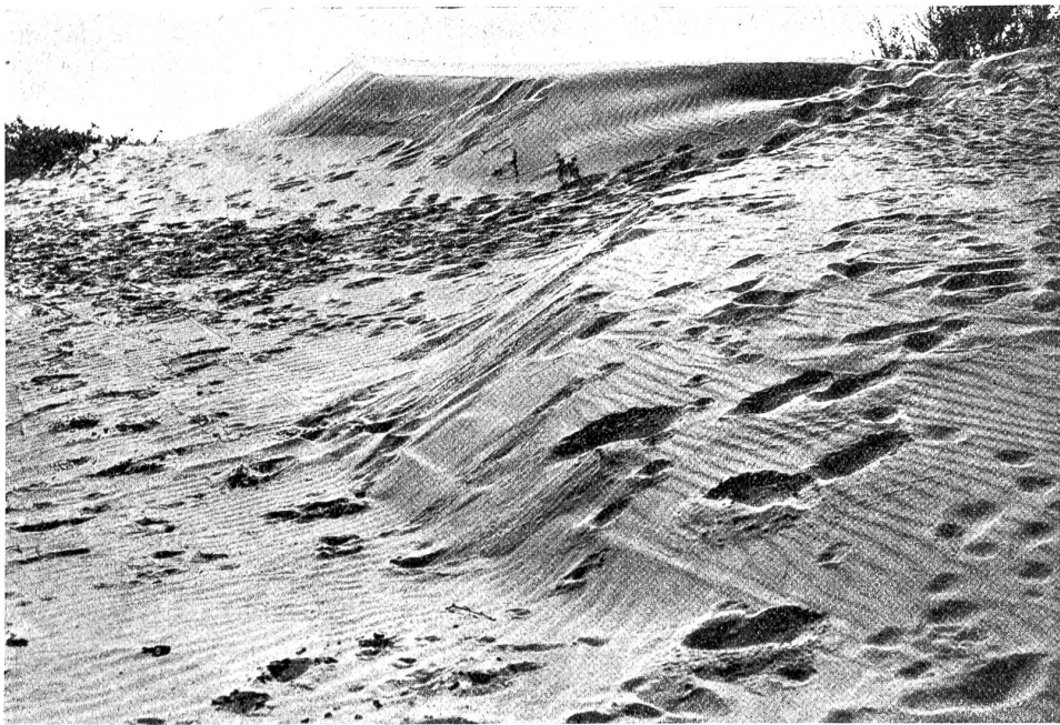
Allenby-Strasse in Tel-Aviv im Jahre 1921.

entsagungs-vollen Lebens. In die Wüste konnte er sich zurückziehen, um nachzudenken, sich zu sammeln, und sich zu rüsten für den Kampf. Ein anderer Gedanke noch ließ mir auf meinen Fahrten in Palästina lange keine Ruhe. Wie kam es, daß dieses an Fläche kleine Land im Geistesleben der Menschheit eine so große Rolle spielte und immer noch spielt. Die Landkarte gibt die Antwort. Palästina ist vergleichbar einer Brücke. Sie verbindet das Morgenland mit dem Abendland. Hier, nur hier konnten sich jene Kämpfe abspielen, die die Menschheit jahrhundertlang in Spannung hielten. Die Reiche der Ägypter, der Äreter, der Griechen und der Römer, sie sind untergegangen. Ruinen sind ihre Zeugen. Das Reich Jesu Christi, es lebt und überdauerte alles.