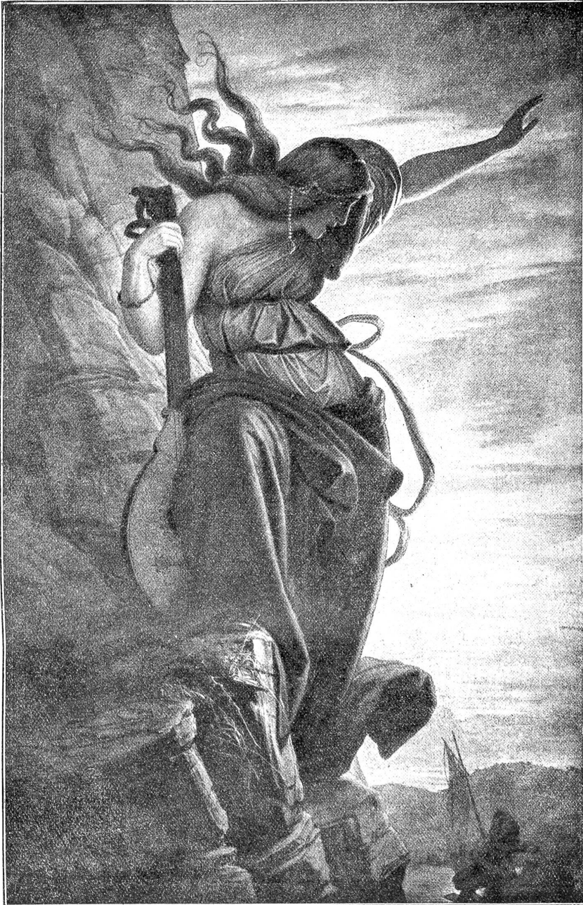
Edward v. Steinle: Loreley.