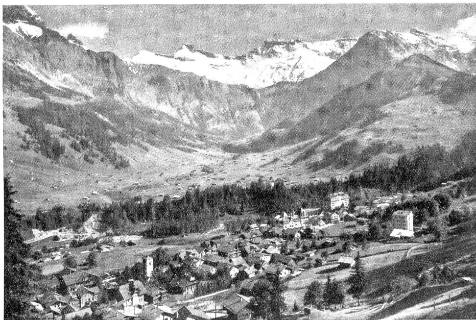
Adelboden mit Steghorn und Wildstrubel.

bot uns eine zu farge Arbeitszeit, wir setzten ihr des Morgens und des Abends zu, dennoch war sie unser liebster Gefährte, wir grüßten sie, wenn sie morgens zu uns stieß und wünschten ihr geruhlsame Nacht, wenn sie uns abends verließ und tief am Himmel uns winkte, ihrem Beispiele zu folgen.