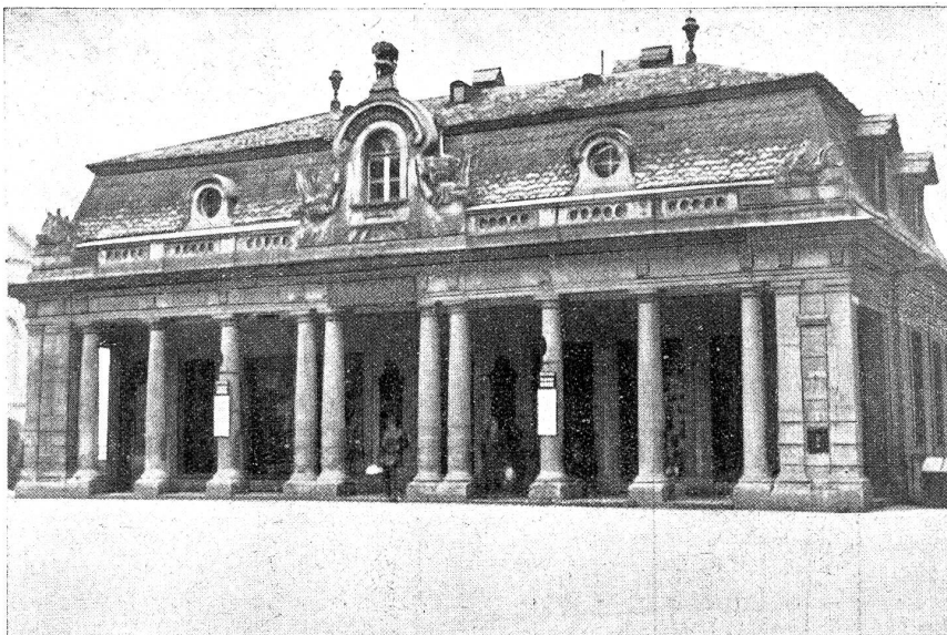
Die „Alte Hauptwache“ in Bern und die Kasinoplatzfrage.

Uebrigens taucht dieser „Toilettenstreit“ schon seit ich denken kann immer zugleich mit der Hundstagsfeeschlange auf, die z'Bären dermalen allerdings durch die „Kasinoplatzfrage“ ersetzt wurde. Die will nämlich auch nicht zur Ruhe kommen und da die Aestheten das Hauptgewicht auf einen baulich schönen, die Verkehrsanbieter aber auf einen geräumigen Kasinoplatz legen, so wird die Frage wohl überhaupt nicht so bald entschieden werden. Der Kasinoplatz aber wird auf irgendeine Art und Weise umgebaut werden, mit der dann überhaupt niemand mehr zufrieden ist. Wir z'Bären sind ja doch meist nur für Mittellösungen zu haben, das heißt, beide Parteien parlamentieren so lange um den heißen Brei herum, bis keine mehr weiß, was sie ursprünglich eigentlich wollte und dann einigen sie sich auf eine Lösung, an