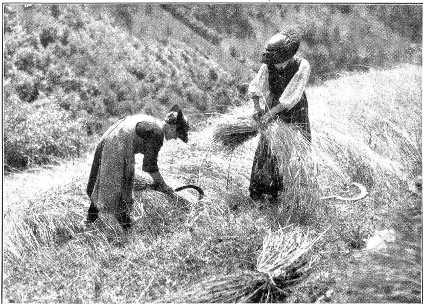
Roggenernte im Val d'Hérens. Auch während der Feldarbeit trägt die Evolenerin ihre schmucke Tracht.