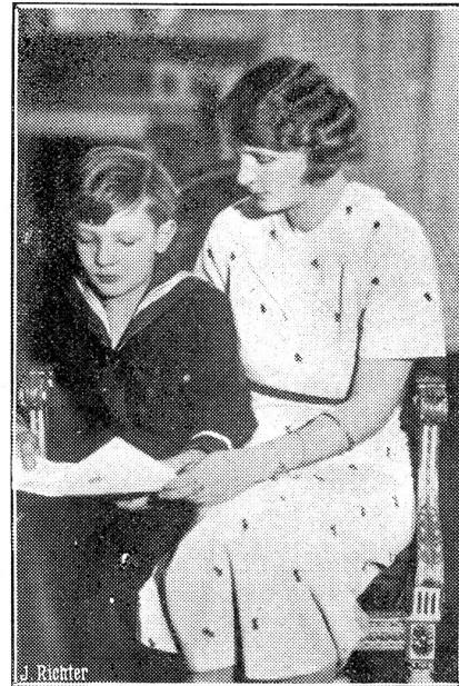
Die Gattin des österreichischen Bundeskanzlers, Frau Herma von Schuschnigg, die kürzlich bei einem Autounfall ums Leben kam, mit ihrem 9-jährigen Sohn.

In Lyon hat Herriot den Kommunisten eine Vorlesung über ihr Betragen ihm und den Linksbürgerlichen gegenüber gehalten. Das „ferne Land im Osten“ bereitete