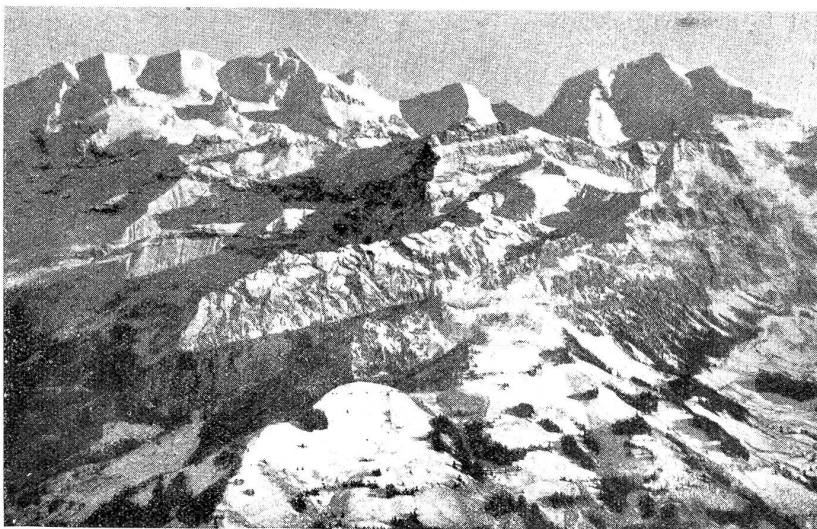
Blick vom Niesengipfel auf Blümlisalp und Doldenhorn.

„Der korrekte Vetter erwartet den gelehrten Vetter im Café Kranzler, Unter den Linden!“