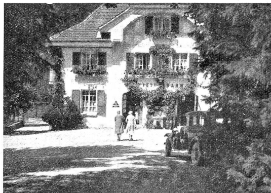
Gebäude der Talstation in Mülmen.

In 33 Minuten fährt die Bahn von Mülmen (693