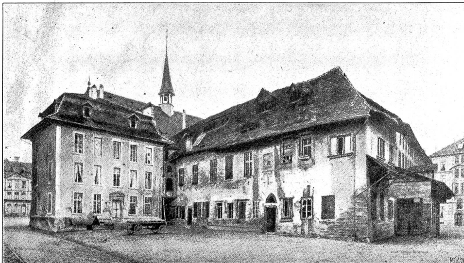
Ostfront des ehemaligen Dominikaner-Klosters in Bern; in dem Gebäude links ist gegenwärtig die städtische Feuerwehr untergebracht.