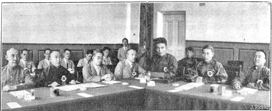
Die Mandschuli-Konferenz tagt.

Lord Siegelbewahrer Eden hat Laval in Paris besucht und ... habe ihn völlig über das deutsch-britische Flottenabkommen beruhigt. So meldet ein Communiqué. Was hat Eden Laval gesagt? Wirklich nur das Eine, daß England nach wie vor an den Abmachungen vom Februar festhalte und weiterhin in der gleichen Front mit Frankreich stehen wolle? Die grundsätzliche Bedeutung des Flottenabkommens besteht darin, daß die Deutschen ihre Flotte nie über 35 Prozent der gesamtbritischen steigern dürfen. Dem deutschen Wettrüsten ist damit ein Riegel geschoben. Das von England hiemit zum erstenmal gegebene Beispiel soll aber Schule machen. So ist es der Wille Englands. Die Deutschen sollen noch eine Reihe von Konzessionen erhalten, mit jeder Konzession aber einen weiteren feierlichen Verzicht leisten.