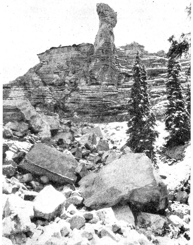
Der letzte Turm am „Vreneli“ von Isenfluh.