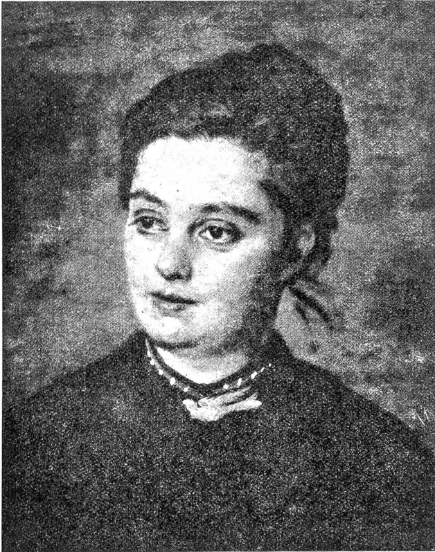
Rudolf Koller: Bildnis einer jungen Frau.

aus einem vertraulichen Lächeln heraus. „Du seht doch nicht so dumm, du! Und sitz wieder ab!“