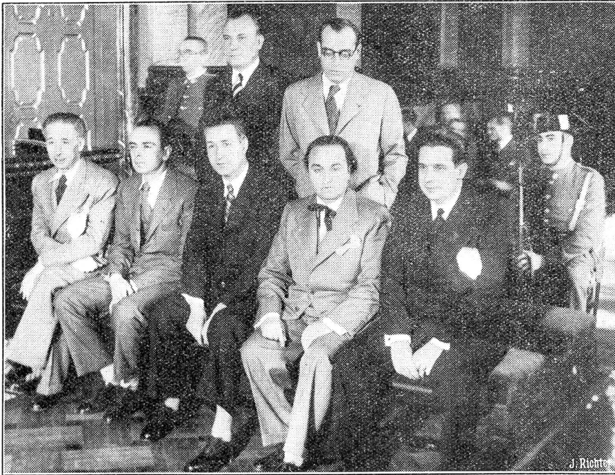
Die Führer der separatistischen Rebellion Cataloniens auf der Anklagebank.

In Madrid begann dieser Tage vor dem Obersten Gerichtshof der Prozess gegen die catalonischen Separatistenführer, die im Oktober 1934 die Unabhängigkeit Cataloniens erklärt hatten. Bekanntlich wurde dieser Aufstand von den spanischen Truppen niedergeschlagen. Unser Bild zeigt den Haupttrüffelsführer, den Expräsidenten von Catalonien M. Companys (links), neben ihm seine Mitverschworenen.