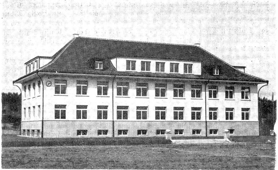
Das am 5. Mai eingeweihte neue Schulhaus in Zollikofen, ausgeführt nach den Plänen von Arch. C. Naegelin in Bern.

Nebst den acht Klassenzimmern enthält das neue Schulhaus die nötigen Spezialräume wie einen Sing- und Versammlungsaal mit Projektionseinrichtung, ein Zeichenzimmer, ein Lehrerzimmer, eine erst noch auszustattende Schul-