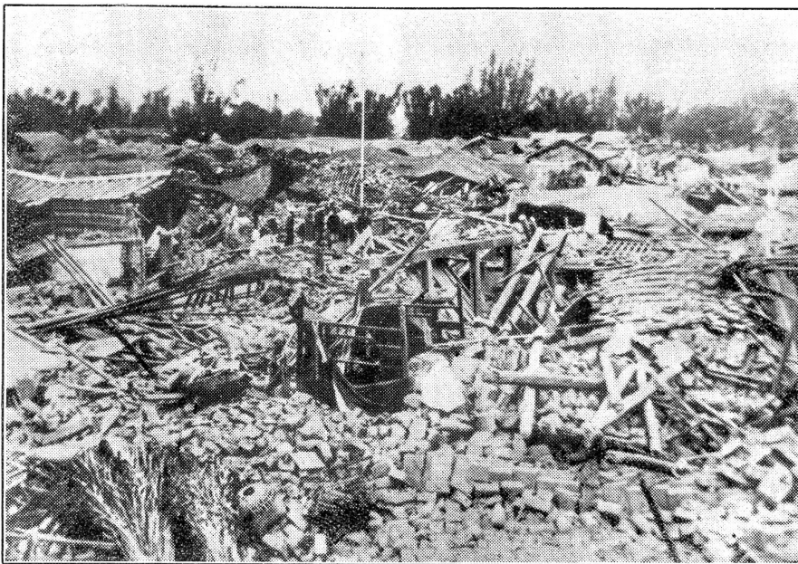
Formosa nach der Erdbebenkatastrophe.

Polen hat seinen „Marshall“ verloren, seinen Neubegründer sozusagen. Der einstige Sozialist, der im zaristischen Rußland ähnlich arbeitete wie etwa heute die illegalen Kommunisten im Dritten Reich, spielte seit seinem Staatsstreich von 1926 die Rolle Mussolinis und bestimmte innen- und außenpolitisch weitgehend den Kurs seines Reiches, das er gern auf den Umfang der alten „Republik Polen“ gebracht hätte; dazu fehlt noch etliches, z. B. Kiew und die ganze westliche Ukraine, Weißrußland bis über Mohilew hinaus, Litauen, und wenn man die Geschichte noch weiter verfolgt, auch das deutsche Ostpreußen. Allein auch Lettland war einmal polnisch, und es gab Zeiten, wo der Zugang zum Schwarzen Meer beinahe erreicht war. Mag Pilsudski den Romantikertraum dieses „Umfanges“