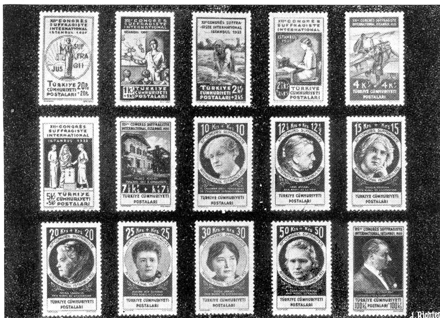
Eine neue türkische Markenserie, entworfen von Kunstmalers Jules Courvoisier.

auf Neußerlichkeiten einen so großen Wert zu legen; doch ist es mit den Jahren noch viel ärger geworden. Meine Frau will nämlich nicht altern, sie will immer noch so schön sein wie vor zehn Jahren. Das ist aber nun doch ein Unding! So steht sie eben fast den ganzen Tag vor dem Spiegel, malt und forrigiert, pinxelt und rasiert an sich herum, daß es ein wahrer Jammer ist! Wie kommt es nun, daß deine Elfriede so hübsch geworden ist?"