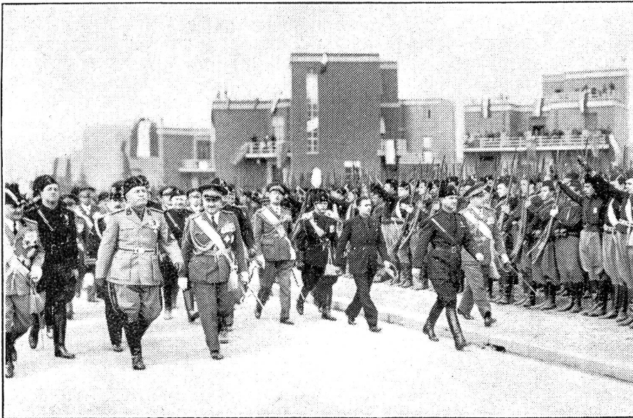
Mussolini gründet Guidonia, die 4. Stadt von Pontinien.

In den Pontinischen Sümpfen ist nun die 4. Stadt erstanden. Mussolini nahm an der Gründungszeremonie teil. Guidonia, die frisch erbaute Stadt, liegt in der Nähe des Flughafens Montecelio, 20 km von Rom, und ist mit seinen kleinen, modernen Häusern fast nur für Flieger-Familien reserviert. Der Name dieser Stadt stammt von General Guidoni, der am 27. April 1928 bei Fallschirm-Experimenten den Tod fand. Der Regierungschef hielt zur Einweihung von Guidonia eine Rede, in der er bemerkte, daß Italien mit dieser Gründung ein neues Zeugnis ablegt von seinem Arbeitswillen. Unser Bild zeigt Mussolini die Strassen von Guidonia durchschreitend.