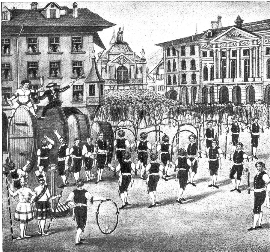
Küfertanz am Ostermontag im Alten Bern.