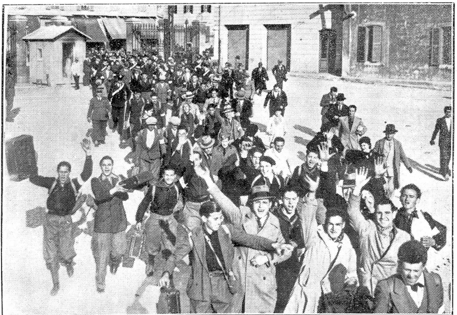
Italien ruft die Klasse 1914 unter die Fahnen.

Der französische Standpunkt scheint auch in der Beurteilung Deutschlands zu gipfeln, aber es will, daß die drei Mächte eine solche durch den Völkerbund aussprechen lassen. Die in Genf ausgesprochene Verdammung, so denkt Paris, habe mehr Gewicht als ein nur von Mussolini und Frankreich gefälltes Urteil.