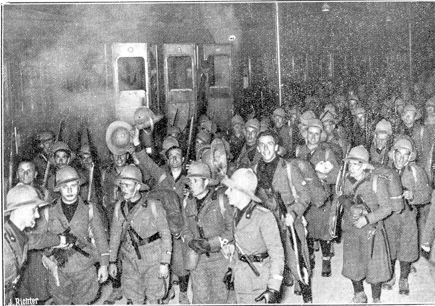
Zu den Vorgängen Italien-Abessinien. Abfahrt italienischer Soldaten nach Somaliland.

Unterzeichnung von Donau- und Ostpakt geknüpft worden, klingt in Paris beinahe wie Engelsmusik. Und wenn die Deutschen weiterhin die beiden Pakte negieren, so lange, bis London sich unlöslich ins französische Bündnisgefüge eingelassen, ist Paris trefflich gedient. Denn der französische Imperialismus weiß genau, daß eine Vergrößerung Deutschlands um Oesterreich, den Korridor, Ostseegebiete und vielleicht tschechische und dänische Grenzstreifen die kontinentale Uebermacht des „Erbfeindes“ endgültig besiegelt. Frankreich aber will nicht eine „Macht zweiten Ranges“ werden. Und darum ringen seine Regierungen, ob links oder rechts gerichtet, mit einer Zähigkeit sondergleichen um die Stabilisierung der gegenwärtigen Machtverhältnisse.