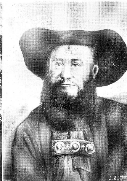
Zum 125. Todestag Andreas Hofers am 20. Februar 1935.

Links: Andreas Hofers Geburtshaus, das Wirtshaus „Am Sande“ zu St. Leonhard im Passeiertal. Rechts: Der Tiroler Freiheitsheld Andreas Hofer.