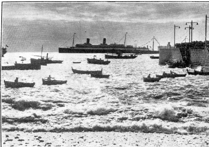
Der silberne Hafen von Funchal.

Es gibt Leute, die Englands gegenwärtige Führung bewundern und meinen, es brauche viel Vertrauen zu den Menschen, um dem Dritten Reich und seiner kriegerischen