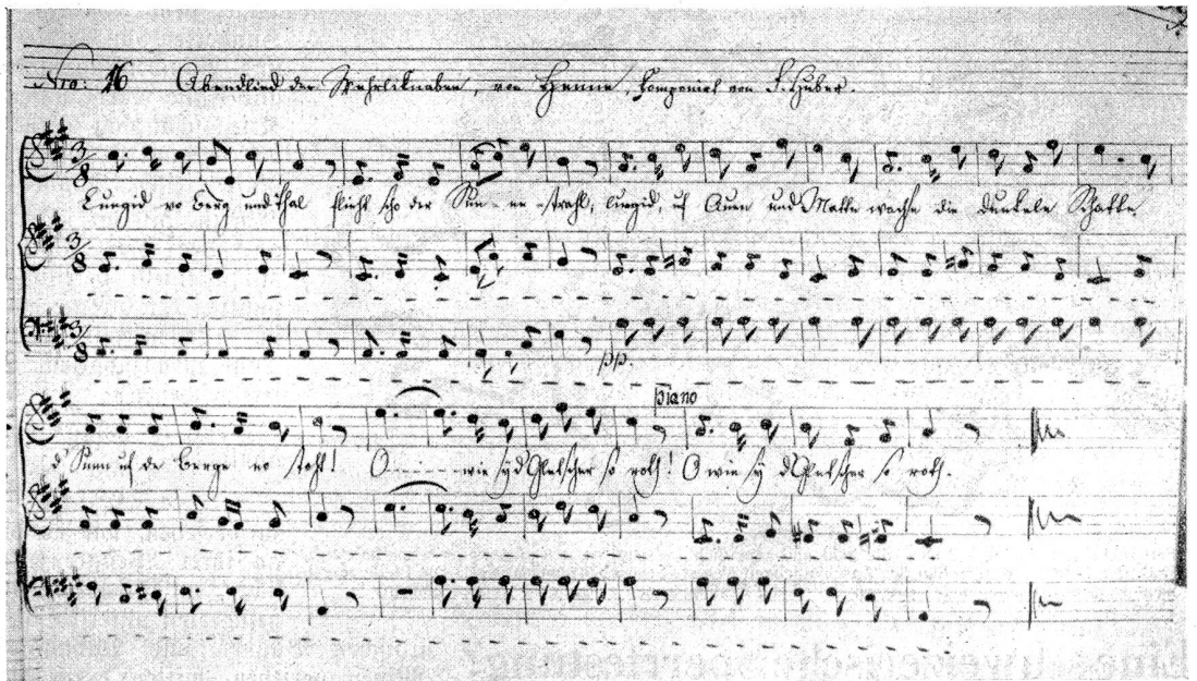
„Luegid vo Berg und Thal“ in der Originalhandschrift des Komponisten.

„Lueged vo Berg und Thal“ ist in Hofwil bei Bern entstanden! Damals, als in den Räumen des Seminars noch Emanuel von Fellenbergs bekanntes „Erziehungsinstitut für Söhne höherer Stände“ blühte. Der junge Pädagoge und Doktorand J. A. Henne von Sargans weilte dort um 1823/24 als Deutschlehrer, und der Bekanntschaft des damals kaum 25jährigen Dichters mit Ferdinand Huber, der von 1817 bis 1824 die Stelle eines Musiklehrers am Institut inne hatte, verdanken wir unser Lied. Henne von Sargans war eine der interessantesten Erscheinungen der schweizerischen Romantik; in späteren Jahren machte er als Historiker und Politiker von sich reden, unter den lyrischen und epischen Versuchen seiner Jugendjahre aber findet sich manche Perle schweizerischer Mundartdichtung. Zu gleicher Zeit wirkte in Hofwil auch der Pädagoge und Schüler Pestalozzis, J. J. Wehrli, der dort eine an Fellenbergs Institut angeschlossene Kolonie für verwaiste Knaben leitete. Für diese „Wehrliknaben“ ist das Lied entstanden und fand sich als solches in der Fassung für zweistimmigen Chor von Knabenstimmen, begleitet vom Bass des Lehrers, in einem Notenheft F. Hubers aus der Hofwilerzeit. Unser Bild zeigt die photographische Aufnahme der Handschrift des Komponisten. Später begab sich Huber wieder in seine Vaterstadt St. Gallen, wo er lange Jahre als Musiklehrer für die Schuljugend tätig war. Das Lied aber fand von Hofwil aus rasche Verbreitung und Beliebtheit unter allen Schichten des Volkes.