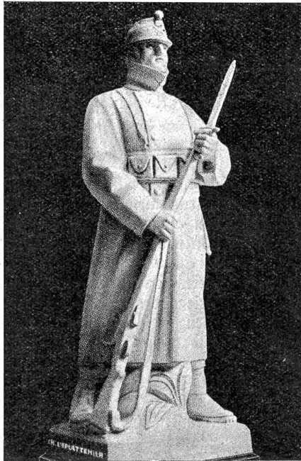
Das Soldatendenkmal auf Les Rangiers.

verzweifelt gegen die Strömung, um — immer am gleichen Fleck zu bleiben. Nur ein sekundenlanges Nachlassen, und er wäre in den sichern Tod gerissen worden. Nach langem