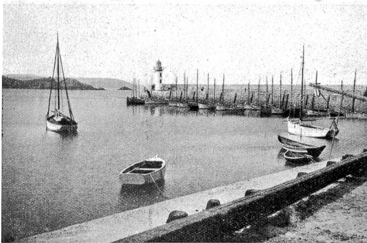
Hafen von Erquy.