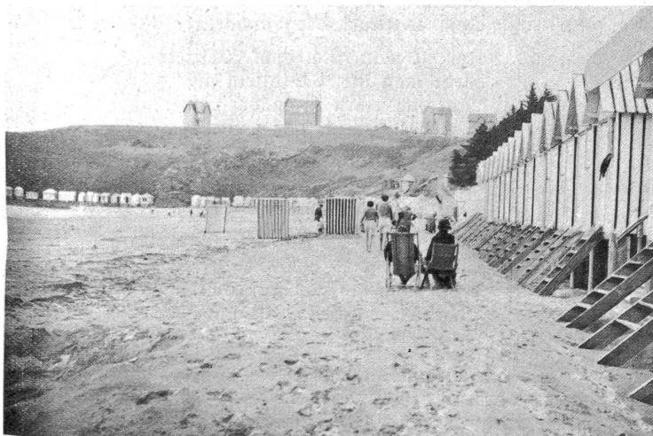
Plage von Caroual bei Erquy.

Die Beschaffung und Verteilung von reichem, gesundem Lesestoff unter Fernhaltung jeder Schund-