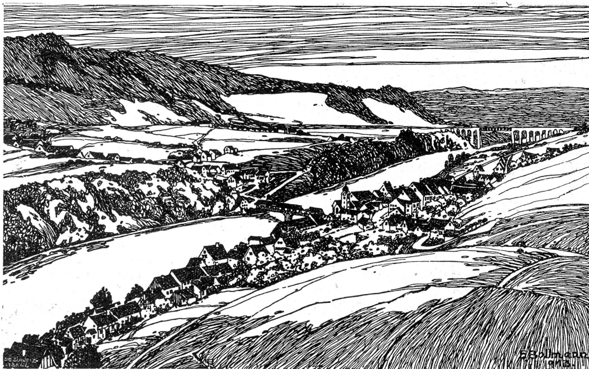
Eglisau. Zeichnung von E. Bollmann.

ihr umzublicken. Als ob er schon oft im Unfrieden von ihr geschieden wäre.