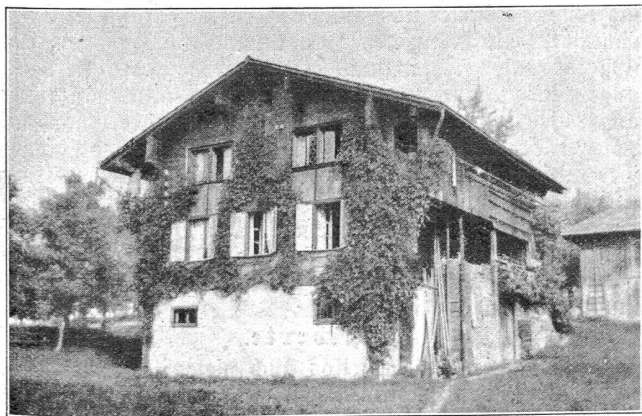
Das Häuschen in Sachseln, wo Heinrich Federer seine Jugendjahre verbrachte.