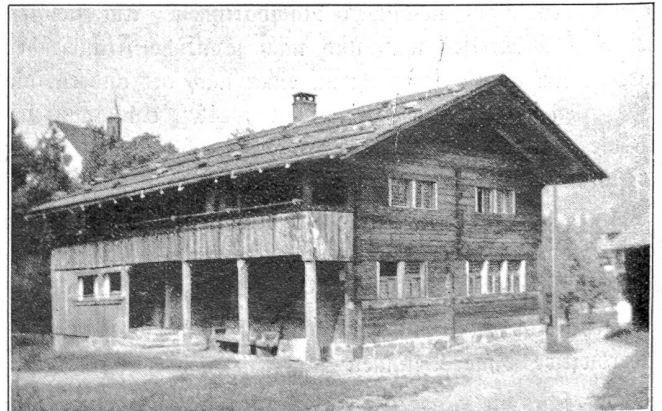
Flühli, Geburtshaus des Niklaus von der Flüe.

Da ist einmal Sarnen, das große, stattliche Dorf mit seinen Kirchen und Kapellen, Klöstern und Instituten, überragt von der schön gelegenen und sehenswerten Pfarrkirche. Auch der Landenberg, der an Stelle des zerstörten Schlosses nun die Zeughäuser des Kantons trägt, lohnt einen Aufstieg mit schöner Aussicht. Sarnen läßt sich von Kerns aus auf verschiedenen sehr reizvollen Wegen in zirka ½ Stunde erreichen; es besitzt auch ein Museum mit manch wertvollem Gut, eine prachtvoll angelegte, noch im Wachsen begriffene Strandpromenade und ein Strandbad. Den Blick über die blaue Fläche des Sees vermag der ewig griesgrämige Giswilerstod nicht zu trüben. Schilf wiegt sich leise im Wind, Seerosen schaukeln mit den Entlein um die Wette und pfeilschnell schießen die Schwalben über die Wasser-