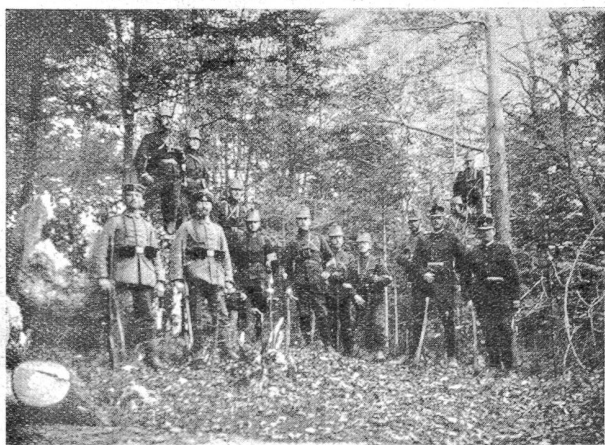
Im Wald bei Ottendorf.

„Sensationell“ wirkte der Urlaub eines Stadtberners, dem die Mutter gestorben war und der für diesen Ausnahmefall für zwei Tage heim durfte. Man umringte ihn nach seiner Rückkehr, um zu hören, wie es in der Bundesstadt aussehe, was die Menschen trieben, wie die Geschäfte gingen usw. Trotzdem man ja durch die Feldpost mit seinen Angehörigen und Bekannten in Verbindung blieb, war man eben doch auf jede Neuigkeit, besonders noch durch einen Augenzeugen, gespannt. Viel bespöttelt wurde ein weiterer