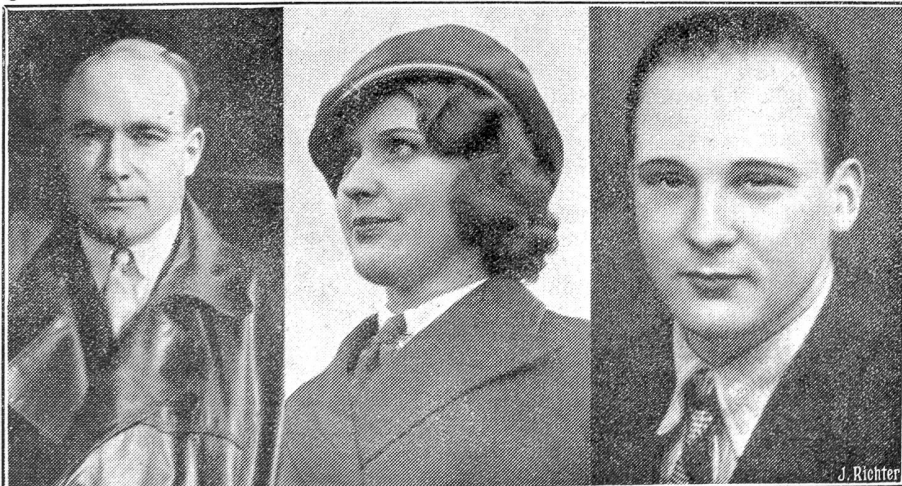
Zum Flugzeugabsturz „Condor“.

Aus dem Kassenschrank der „Radibus A.-G.“ in Basel wurde Ende Juni ein Postschek von über Fr. 5000 gestohlen und das Geld am 2. Juli von einer unbekannten Frau am Postschalter abgehoben. Die polizeilichen Recherchen blieben bis jetzt erfolglos, trotzdem auf die Ermittlung der Täterschaft eine Belohnung von Fr. 500 ausgesetzt wurde. — Auf Veranlassung der Basler Polizei gelang es in Brüssel, Prag und Riga, vier internationale Gauner zu verhaften, die u. a. im Oktober 1932 einem Bieler