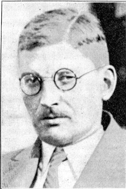
Schuschnigg, der neue österreichische Bundeskanzler.

freiungstruppen verhandelte und den Sturm untersagte, so daß zunächst ein Abkommen zustande kam, das den Rebellen freie Abfahrt ins deutsche Reich zusicherte.