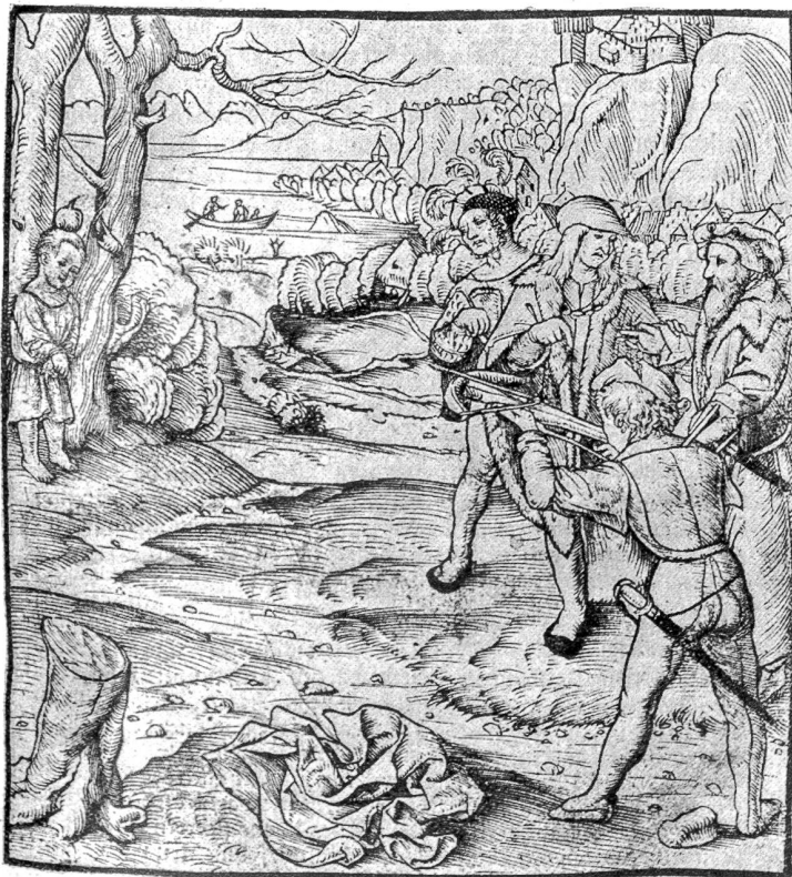
Der Tellenschuss. Nach einem Holzschnitt in Petermann Etterlyns Chronik. Um 1507 entstanden, weist diese älteste Darstellung des Tellenschusses die damalige Tracht des Volkes und der Vornehmen auf.

„Sie sind aus Biel, lauter Arbeiter. Max hat gesagt, es seien Sozi, weil sie rote Krawatten tragen. Ihr Meister ist ein flotter. Weil heute der 1. August ist, hat er ihnen frei gegeben. Den Lohn erhalten sie aber gleich. Und dazu hat er sie noch zu einer großen Autofahrt eingeladen. Damit sie ein Stück Schweizerland