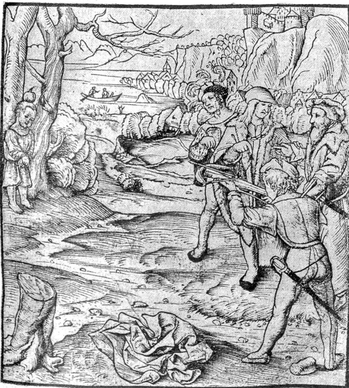
Der Tellenschuss. Nach einem Holzschnitt in Petermann Etterlyns Chronik. Um 1507 entstanden, weist diese älteste Darstellung des Tellenschusses die damalige Tracht des Volkes und der Vornehmen auf.