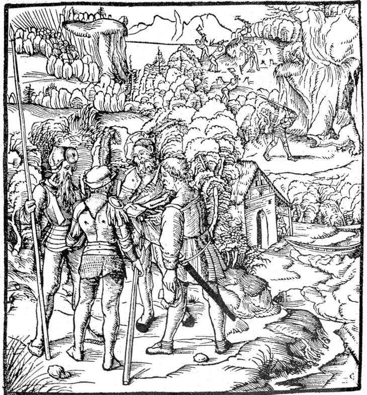
Gründung der Eidgenossenschaft. Nach einem Holzschnitt in Petermann Etterlyns Chronik, Basel 1507.

und dem Chauffeur traute ich stillschweigend zu, daß er eine Bubenhorde im Zaum zu halten vermochte. Man möge nicht vergessen, daß Chauffeure bei der Jugend als