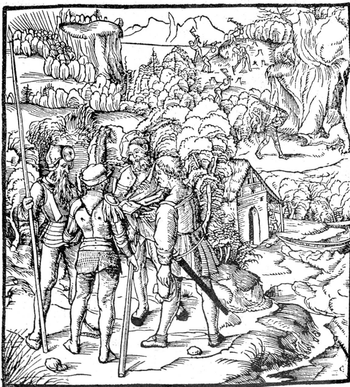
Gründung der Eidgenossenschaft. Nach einem Holzschnitt in Petermann Etterlyns Chronik, Basel 1507.

Ich ließ sie gewähren. Verderben konnten sie nichts. Die Insassen des Car alpin waren lauter Männer, wie ich von meinem Liegeplatz aus sah, und dem Chauffeur traute ich stillschweigend zu, daß er eine Bubenhorde im Zaum zu halten vermochte. Man möge nicht vergessen, daß Chauffeure bei der Jugend als