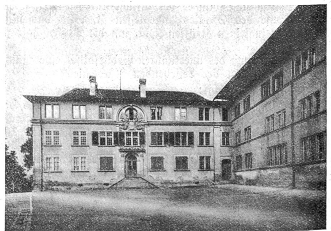
Der Kollegienbau der alten Hochschule, Ostansicht. 1682 durch Samuel Jenner erbaut.

Im Auslande fand die Universität Bern viel Anfeindung. Zahlreiche Regierungen sperrten für ihre Bürger den Besuch, weil sie von den freieitlichen Ideen, die hier gelehrt wurden, unangenehme Rückwirkungen auf ihr Land befürchteten. Preußen hob die Sperre erst 1842 auf, machte aber auch dann den Besuch von einer Bewilligung abhängig. In der Schweiz hinwieder taxierte man die Gründung der Berner Hochschule als Akt der Eifersucht gegenüber Zürich, das im Jahre 1833 seine Universität erhalten hatte. Uebrigens gab der akademische Senat den auswärtigen Hochschulen erst 1836 offiziell Kenntnis von der Gründung, den Wunsch gegenseitigen Verkehrs äußernd.