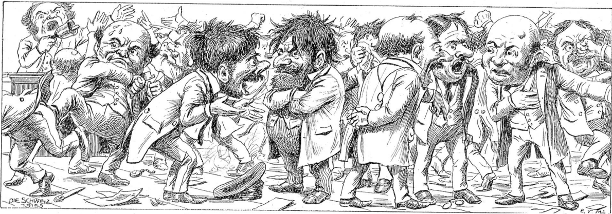
Aufgeregte Sitzung. Zeichnung von E. van Muyden.

Bei Tische zeichnete er sie nun immer vor allen andern Damen durch besondere Aufmerksamkeit aus. Sie wollte jedoch vor ihm auf der Hut sein. Obgleich er, wie sie nun auch zugeben mußte, ein Mann war, der ein Frauenherz bald in Wallung versetzen konnte. Ihr früheres Urteil über ihn und vor allem über Frau Wehrlin wurde nun um vieles milder. Sie wußte ja nicht, wie die Schicksale der beiden zusammenhingen. Und es ging sie ja auch nichts an. Jetzt dachte sie nur noch an sich selber. Warum dieser schöne kluge Mann sich nun so sehr um sie kümmerte? Sicherlich war sie älter als er, und es waren schönere und jüngere Frauen da, um deren Gunst er sich hätte bewerben können. Es war seltsam. Was er nur von ihr wollte? Sie nahm sich vor, wie bisher freundlich gegen ihn zu sein; denn es bereitete ihrem Herzen und auch ihrer Eitelkeit ein wohliges Behagen, von einem so hervorragenden Manne mit Aufmerksamkeiten bedacht zu werden. Aber innerlich wollte sie kühl bleiben. Sie war fünfunddreißig Jahre alt und mit der Zeit zu einer guten inneren Ruhe gekommen. Was sollte ein Mann nun noch in ihrem Leben?