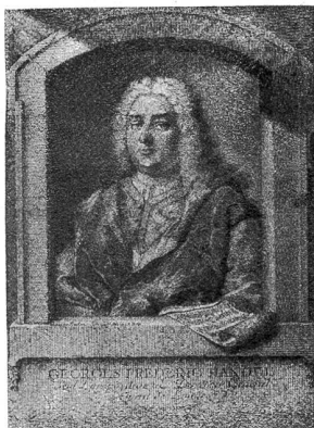
Georg Friedrich Händel.

Hatten die Gegner des „Sachsen“ bisher nur geheime Wühlarbeit gegen ihn verrichtet, nun, angesichts seiner überhandnehmenden Erfolge, traten sie aus allen Lagern offen auf