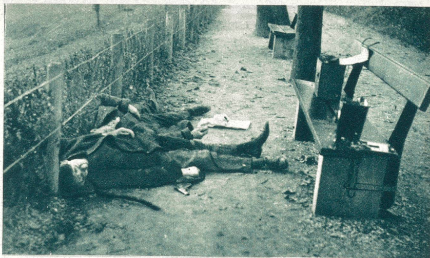
Die Leichen der beiden siebenfachen Mörder im Margarethenpark in Basel. Die Verbrecher hatten sich, nachdem der Park von der Polizei umstellt worden war, gegenseitig erschossen.