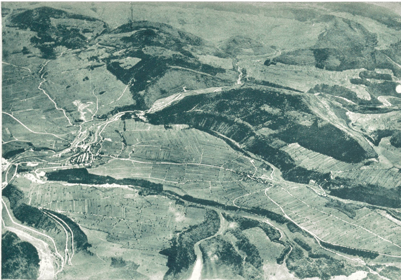
Fliegeraufnahmen aus dem Gebiet, das anlässlich der Verbrecherjagd auf die Wever-Bank-Räuber von der Polizei besetzt wurde. Laufen-Röschenz, aufgenommen aus 3000 Meter.