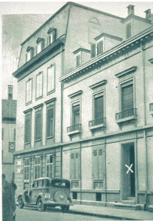
Die Privatpension an der Sperrstraße in Klein-Basel,

von wo aus die beiden Mörder die Flucht ergriffen hatten, zuerst zu Fuß und nachher per Velo, nach ihrem Revolverangriff auf die beiden Detektive der Schrittkontrolle. — Links vom Bild das Restaurant zum »Goldenen Faß«, wo der tapfere Zählen den im Blute liegenden Polizeibeamten Nafzger, den einen der Detektive, vorfand und daraufhin sofort im öffentlichen Interesse die Verfolgung aufnahm. Hätte das Straßenpublikum seinen Zurufen einigermaßen Folge geleistet, so hätte man vielleicht die Mörder schon in Basel erwischen können.