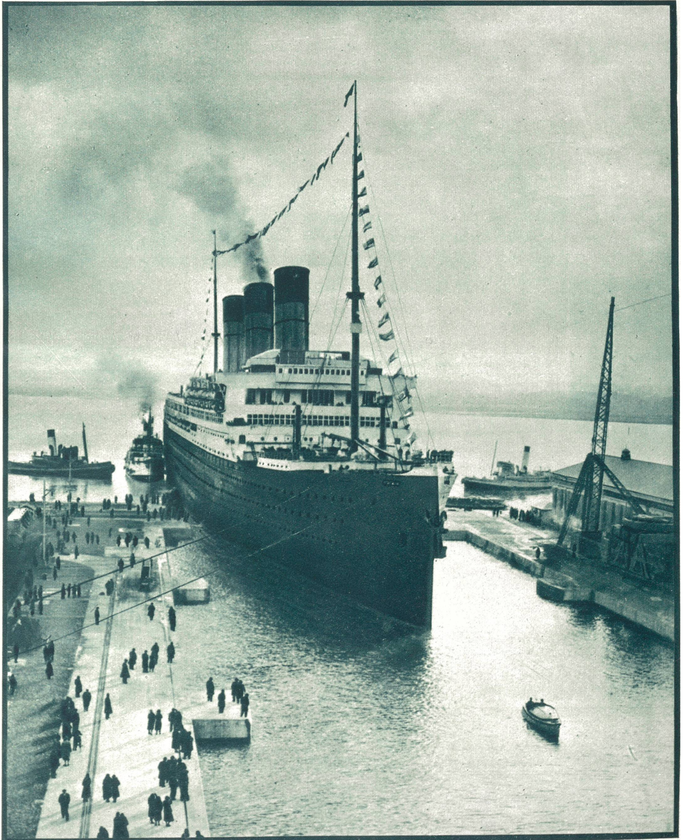
Der Welt größtes Schiff im größten Dock der Welt.